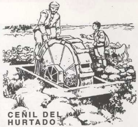
CEÑIL DEL HURTADO